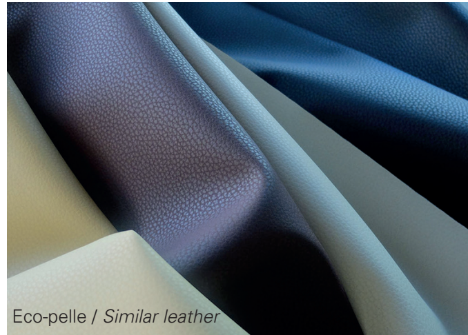
Eco-pelle / Similar leather