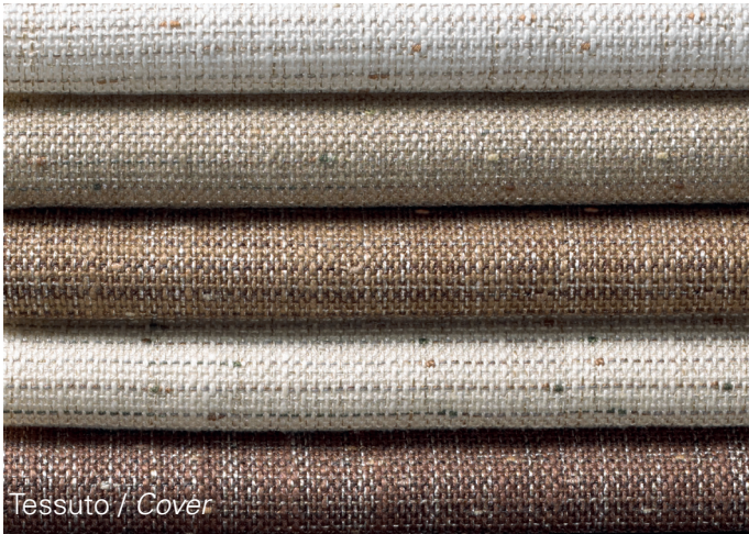
Tessuto / Cover

Materials: Polyurethane mattress is made by a polyurethane foam core with no C.F.C., with a density of 40 kg/mc non-deformable, covered with a heat sealed layer. The covering fabric is in polyester and modacrylic fiber. All materials are fire retardant and moreover mattresses are 1 IM fire reaction class in accordance with the strict laws of Italian rules.