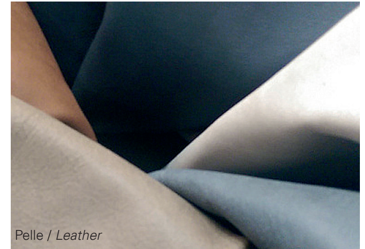
Pelle / Leather