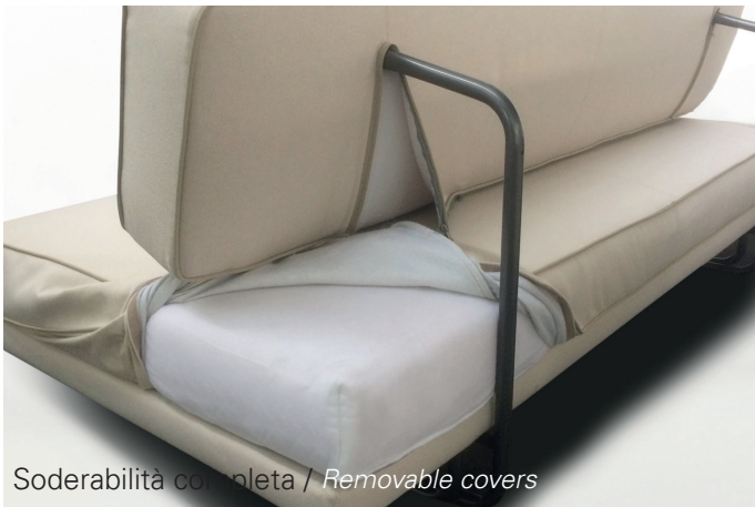
Soderabilità completa / Removable covers