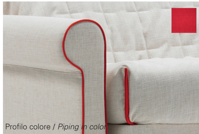
Profilo colore / Piping in color